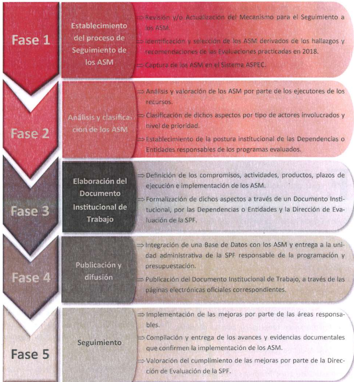
Figura 1. Proceso de Seguimiento a los ASM 2019.

por el Consejo Nacional de Evaluación de la Política de Desarrollo Social (CONEVAL), así como por la Secretaría de Hacienda y Crédito Público (SHCP), en materia de Consistencia y Resultados y de Diseño, respectivamente. Este proceso tiene como propósito establecer el mecanismo oficial con el cual las evaluaciones contribuyen a la mejora continua del ciclo presupuestario, y dicho proceso contempla las fases descritas en la Figura 1. Proceso de Seguimiento a los ASM 2019 .